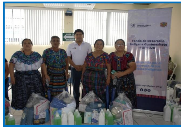
Fuente: propia FODIGUA "Plan para la dotación de kits básico a comadronas para parto seguro". Antigua Guatemala, departamento de Sacatepéquez. octubre 2024.