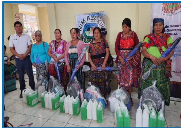
Fuente: propia FODIGUA "Plan para la dotación de kits básico a comadronas para parto seguro". Municipio de Santa Cruz del Quiché, departamento de Quiché. octubre 2024.