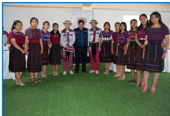
Fuente: propia FODIGUA, “Encuentros Interculturales. Municipio de Huehuetenango, departamento de Huehuetenango. Octubre 2024.

Promover la diversidad cultural de la juventud, para favorecer así las relaciones interculturales en la sociedad guatemalteca