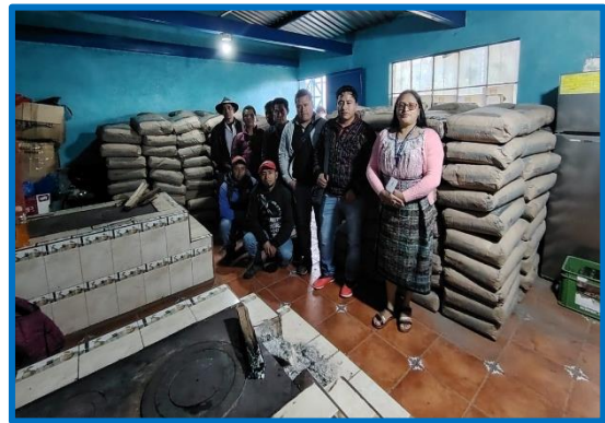
Apoyo con la dotación de materiales para el Mejoramiento de la Infraestructura Vial, Caserío Las Trampas, Cantón Pujujil III, municipio de Sololá, departamento de Sololá. octubre 2024.