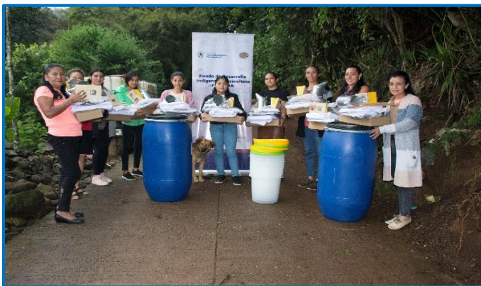
Capacitación “Principios de la Formalización de la pequeña empresa en apicultura”. Municipio de Santa María Ixhuatán, departamento de Santa Rosa. Octubre 2024

La capacitación se llevó a cabo en el municipio de Santa María Ixhuatán, departamento de Santa Rosa.