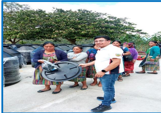
Dotación de depósitos de agua para facilitar la disponibilidad de agua en la vivienda, caserío Panimá, municipio de Sacapulas, departamento de Quiché. octubre 2024.