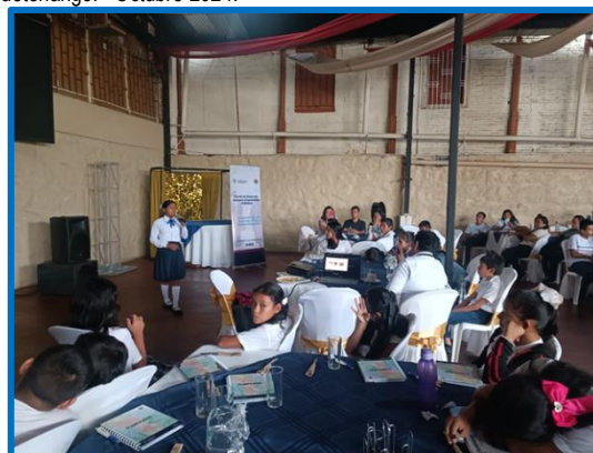
Fuente: propia FODIGUA, "Encuentros Interculturales. Municipio de Mazatenango, departamento de Suchitepéquez. Octubre 2024.

Tabla de población beneficiada de la actividad denominada "Encuentros Interculturales", desarrollado por la Unidad de la Juventud, beneficiando en total a 200 jóvenes