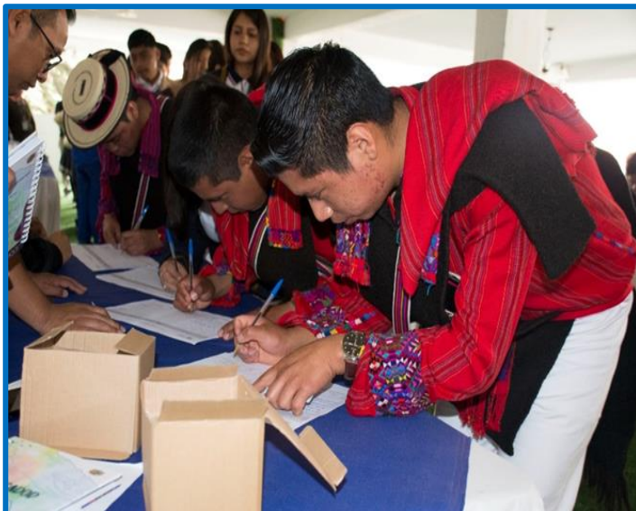
Fuente: propia FODIGUA, “Encuentros Interculturales. Municipio de Huehuetenango, departamento de Huehuetenango. Octubre 2024.

La Unidad de la Juventud, en el mes de octubre atendió 200 jóvenes de los departamentos de Huehuetenango y Suchitepéquez, estas acciones se ejecutaron en la estructura programática Producto: 001-003: Personas indígenas formadas en el ejercicio pleno de sus derechos, Subproducto: 001-003-0004: Jóvenes Indígenas que reciben formación, capacitación y dotación para su desarrollo económico, social y cultural.