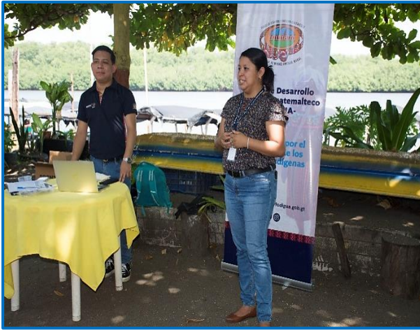
Capacitación "Principios de la Formalización de la pequeña empresa en apicultura". Aldea Las Lisas del municipio de Chiquimulilla, departamento de Santa Rosa. Octubre 2024