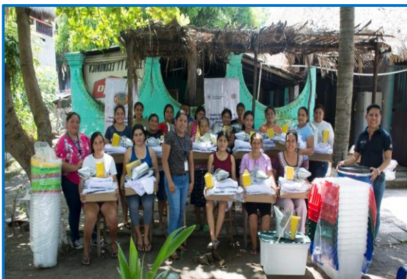
Capacitación "Principios de la Formalización de la pequeña empresa en apicultura". Aldea Las Lisas del municipio de Chiquimulilla, departamento de Santa Rosa. Octubre 2024

Se beneficiaron con la capacitación y dotación de insumos de apicultura a veinticuatro mujeres indígenas Xinkas de la Aldea Las Lisas del municipio de Chiquimulilla, departamento de Santa Rosa para emprender y mejorar su calidad de vida.