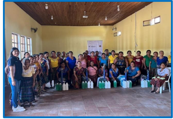
Fuente: propia FODIGUA "Plan para la dotación de kits básico a comadronas para parto seguro". Municipio de Mazatenango, departamento de Suchitepéquez. octubre 2024.