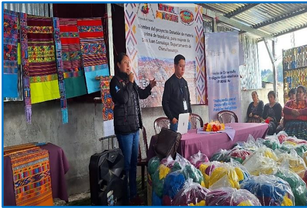
Fuente: propia FODIGUA, Capacitación "Principios de la Formalización de la pequeña empresa en tejeduría", municipio de San Juan Comalapa, departamento de Chimaltenango. Octubre 2024