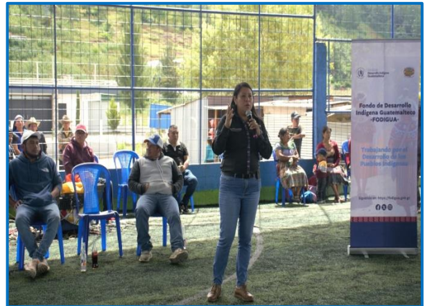
Fuente: propia FODIGUA, Capacitación "Principios de la Formalización de la pequeña empresa en tejeduría", Municipio de San Antonio Ilotenango, departamento de Quiché. Octubre 2024

La capacitación se llevó a cabo en el municipio de San Antonio Ilotenango, departamento de Quiché.