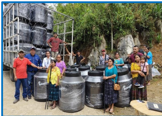
Dotación de depósitos de agua para facilitar la disponibilidad de agua en la vivienda, Caserío Santo Domingo Las Cuevas, municipio de Cobán, departamento de Alta Verapaz. octubre 2024.