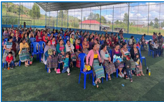
Fuente: propia FODIGUA, Capacitación "Principios de la Formalización de la pequeña empresa en tejeduría", Municipio de San Antonio Ilotenango, departamento de Quiché. Octubre 2024