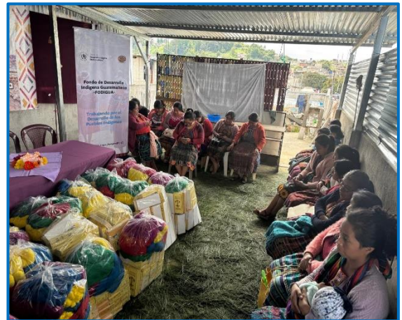
Capacitación "Principios de la Formalización de la pequeña empresa en tejeduría", municipio de San Juan Comalapa, departamento de Chimaltenango. Octubre 2024

La capacitación se llevó a cabo el municipio de San Juan Comalapa, departamento de Chimaltenango.