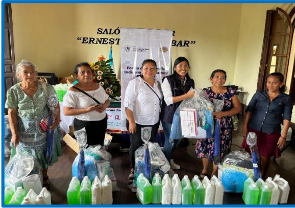
Fuente: propia FODIGUA "Plan para la dotación de kits básico a comadronas para parto seguro". Municipio de Retalhuleu, departamento de Retalhuleu. octubre 2024.