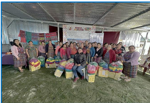
Capacitación "Principios de la Formalización de la pequeña empresa en tejeduría", municipio de San Juan Comalapa, departamento de Chimaltenango. Octubre 2024

Se beneficiaron con la capacitación y dotación de insumos de tejeduría a veinticinco mujeres indígenas del municipio de San Juan Comalapa, departamento de Chimaltenango para emprender y mejorar su calidad de vida.