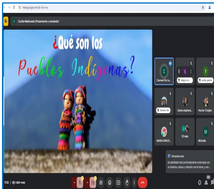
Capacitación virtual “Derechos Humanos de los pueblos indígenas”. Octubre 2024.

Esta actividad estuvo a cargo de la Comisión Presidencial por la Paz y los Derechos Humanos –COPADEFH-, para capacitar a los colaboradores de las sedes regionales que integran el FODIGUA, con la finalidad de poder dar a conocer y poder ampliar los conocimientos básicos sobre los derechos humanos de los pueblos indígenas y de instrumentos internacionales como la Declaración de las Naciones Unidas sobre Derechos de los Pueblos Indígenas (DNUDPI) el Convenio 169 de la Organización Internacional del Trabajo (OIT) y la Convención Americana sobre Derechos Humanos, para su correcta aplicación en el contexto jurídico actual de pueblos indígenas.