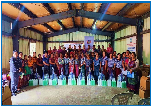
"Plan para la dotación de kits básico a comadronas para parto seguro". Municipio de San Lucas Toliman, departamento de Sololá. octubre 2024.

Las actividades se llevaron a cabo en el municipio de San Lucas Toliman, departamento de Sololá, municipio de Santa Cruz del Quiché, departamento de Quiché, municipio de Quetzaltenango, departamento de Quetzaltenango, Antigua Guatemala, departamento de Sacatepéquez, municipio de Chiquimula, departamento de Chiquimula, municipio de Retalhuleu, departamento de Retalhuleu y municipio de Mazatenango, departamento de Suchitepéquez.