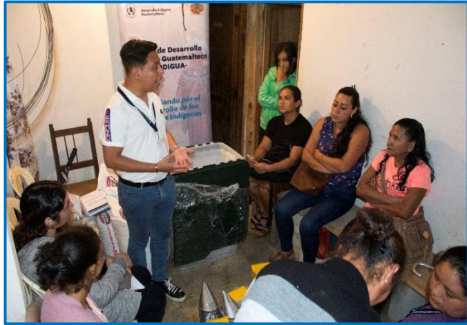
Capacitación “Principios de la Formalización de la pequeña empresa en apicultura”. Municipio de Santa María Ixhuatán, departamento de Santa Rosa. Octubre 2024

Empoderar a la mujer indígena de los Pueblos Maya, Garífuna y Xinka en el ámbito socioeconómico, cultural y social, para crear conciencia, confianza para lograr sus anhelos personales.