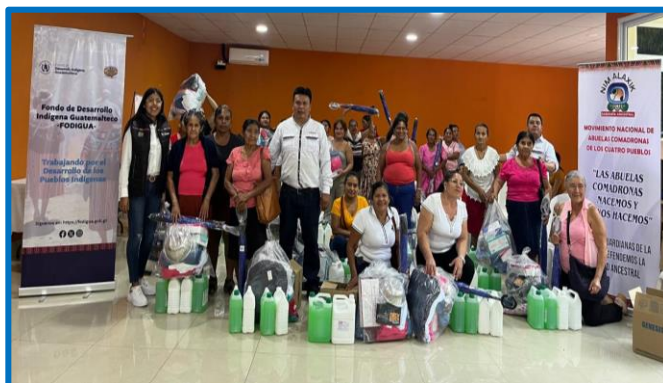
Fuente: propia FODIGUA "Plan para la dotación de kits básico a comadronas para parto seguro". Municipio de Chiquimula, departamento de Chiquimula. octubre 2024.