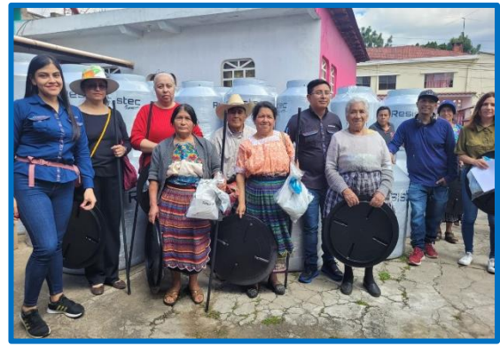
Dotación de depósitos de agua para facilitar la disponibilidad de agua en la vivienda, casco urbano, municipio de Olintepeque, departamento de Quetzaltenango. octubre 2024.