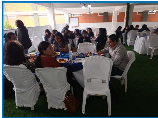
Fuente: propia FODIGUA, "Encuentros Interculturales. Municipio de Huehuetenango, departamento de Huehuetenango. Octubre 2024.