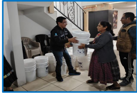
Fuente: propia FODIGUA. Dotación de filtros para facilitar la disponibilidad de agua adecuada para el consumo humano, Barrio Garibaldi, Zona 9, municipio de Quetzaltenango, departamento de Quetzaltenango.