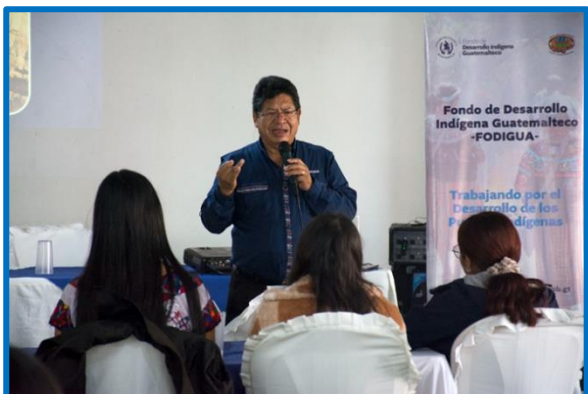
Fuente: propia FODIGUA, “Encuentros Interculturales. Municipio de Huehuetenango, departamento de Huehuetenango. Octubre 2024.