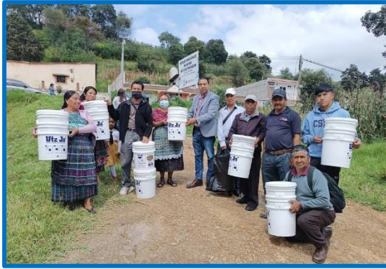
Dotación de filtros para facilitar la disponibilidad de agua adecuada para el consumo humano, Cantón San Isidro, municipio de Olintepeque, departamento de Quetzaltenango. octubre 2024.