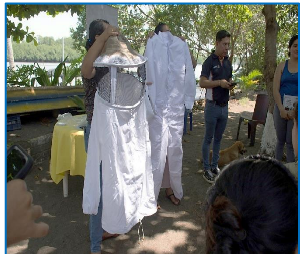
Capacitación "Principios de la Formalización de la pequeña empresa en apicultura". Aldea Las Lisas del municipio de Chiquimulilla, departamento de Santa Rosa. Octubre 2024

La capacitación se llevó a cabo la Aldea Las Lisas del municipio de Chiquimulilla, departamento de Santa Rosa.